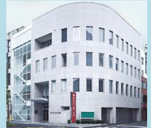
■静岡県司法書士会館■