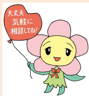
静岡市消費生活センター イメージキャラクター 「かいけつ!ハナミン」

消費生活センターでは、週に1回火曜日の午前中10時~12時(要予約)に法律専門家による多重債務相談を行っています。その日以外にも弁護士や司法書士の相談を30分無料で受けられるように紹介をしています。しかしそれで債務整理はできても、そのあとの生活が前と変わらないままでは、また同じことを繰り返してしまう可能性もあります。多重債務に陥る背景には、低収入や依存症等の問題が隠れていることが多くあるので、そのような場合には債務整理だけでなく家計簿指導や医療・相談機関に結びつけることも必要となってきます。多重債務という表面上の問題だけでなく、そこに至った背景にも目を向けることで根本からの解決を図っています。